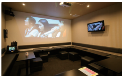
▲カラオケルームは10室増設を実施

ともと他社が経営していたカラオケ店の空き物件をリニューアルしたもので、開業にあたっては20室から30室へとルーム数を10室増やしている。