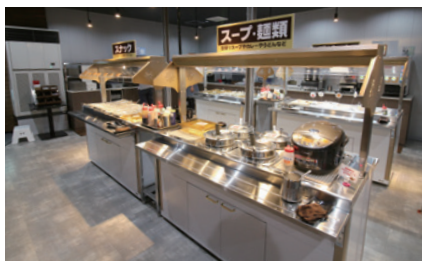
▲充実した飲食を提供するバイキングコーナー

ゲオが展開する既存カラオケ店はいずれもアミューズメント施設との複合施設でルーム数は60室を超え、立地は郊外型を基本としている。瑞穂店についても埼玉県入間市と東京都福生市を結ぶ国道16号線沿いのロードサイドに立地。も