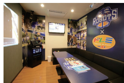
▲水戸OPA店にはプロバスケットチーム「サイバーデザイン茨城ロボッツ」のコンセプトルームを設置

新しいシステムの導入に際しては現場スタッフの理解、協力は欠かせないが、既存店へのオーダーリングシステムの導入にあたっては当初、「シニアのお客さま