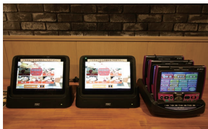
▲「ドレミ」6店舗、全108室にオーダー端末機を設置している

「お客さまの笑顔のために」を理念に掲げ、カラオケ事業を主力に訪問看護事業、外食事業など多角的経営を推進するショット。カラオケ事業については大手チェーンとの差別化を図りながら、水戸OPA店を足掛かりに水戸市以南への出店も積極的に行なう計画だ。