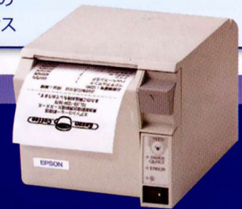
スマートレシートプリンター TM-T70-i